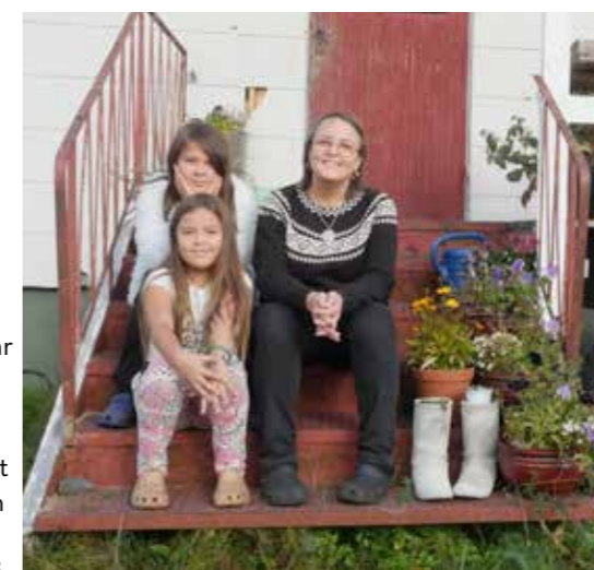
Lite avkoppling och småprat på kvällskvisten hemma i Näsberg

– Ja, absolut, oerhört mycket faktiskt. Det är kul och inspirerande att få vara den första som möter de här människorna, få hjälpa och se dem växa.