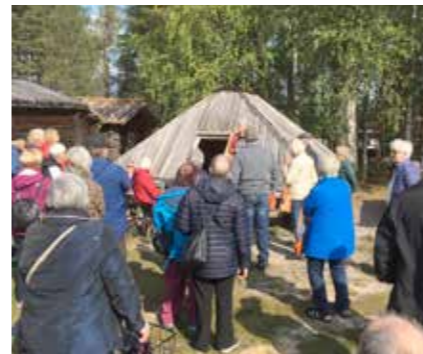
100 års firande i Lappstan i Arvidsjaur