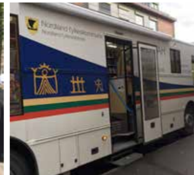
Den samiska bokbussen i Nordlands fylke