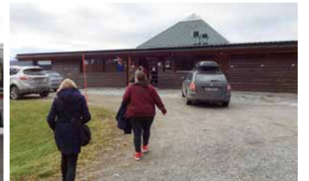
På väg in till samiska språkcentrum Samien Sijte i Hattfjelldal